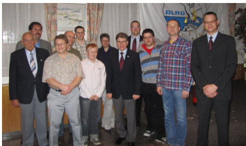
Unsere Jubilare 2010